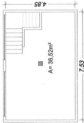
2 MEZANINO ESCALA 1:100

Tribunal Regional Eleitoral de Santa Catarina