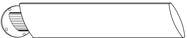
04 PERSPECTIVA TOTEM