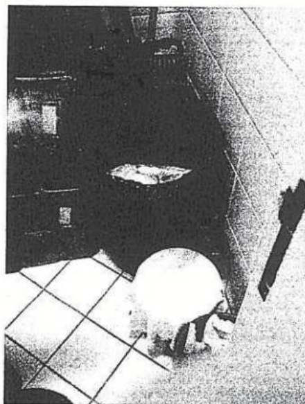
Vista do Depósito (DML e DRSS) existente na SAMEO.