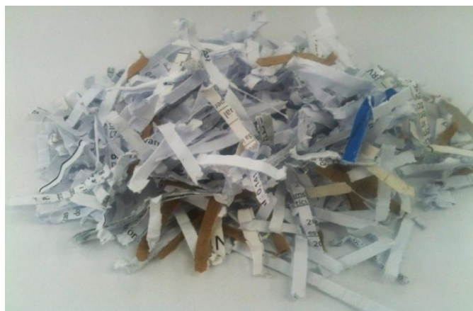
Imagem 02 – Padrão DIN 66.399 – Nível de segurança 3.

Atualmente o nível de segurança 3 da norma DIN 66.399 é capaz de destruir totalmente a folha e impedir a reconstrução do documento.