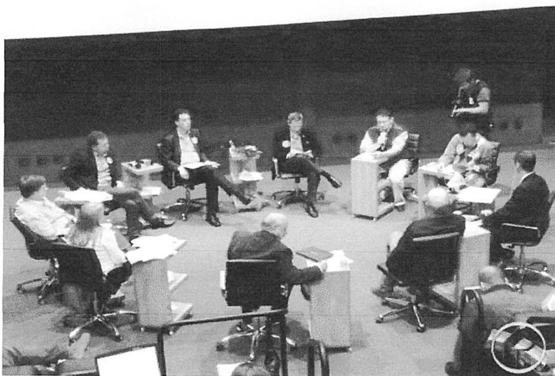
FOTO DOS CANDIDATOS AO SENADO NO DEBATE DA REDE PEPERI NAS ELEIÇÕES 2010