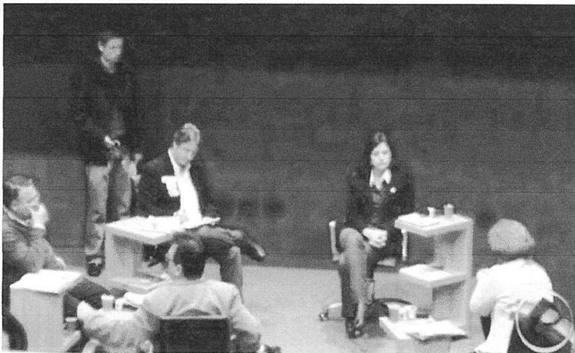
FOTO DOS CANDIDATOS AO GOVERNO NO DEBATE DA REDE PEPERI NAS ELEIÇÕES 2010