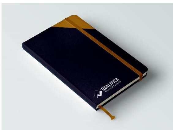
Figura 5: Aplicações da marca 4