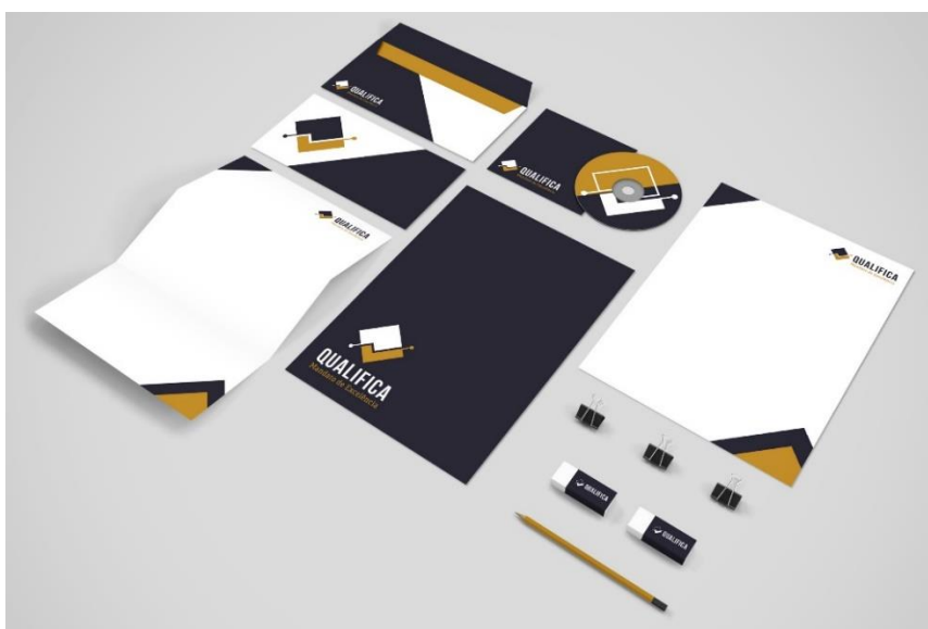
Figura 2: Aplicações da marca 1