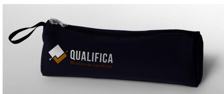
Figura 4: Aplicações da marca 3