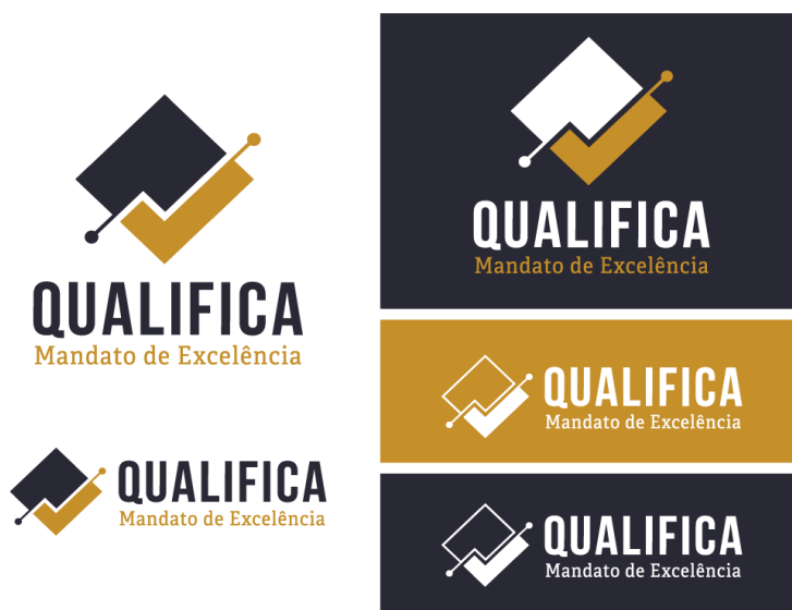
Figura 2: Versões da marca

Assim, a marca compõe-se de dois pontos que se conectam em linha ascendente, marcando o aprimoramento do exercício do mandato refletido em indicadores, fruto das atividades de qualificação; o losango ao fundo remete ao gateway (momento de reflexão e de tomada de decisão) das notações de mapeamento de processos – ponto crucial para o registro e a disseminação das Boas Práticas; e no sinal de validação, decorrente da sobreposição dos elementos anteriores, como elemento representativo do reconhecimento. Os padrões cromáticos adotados foram o azul marinho (sobriedade e formalidade) e o dourado (vitória e excelência).