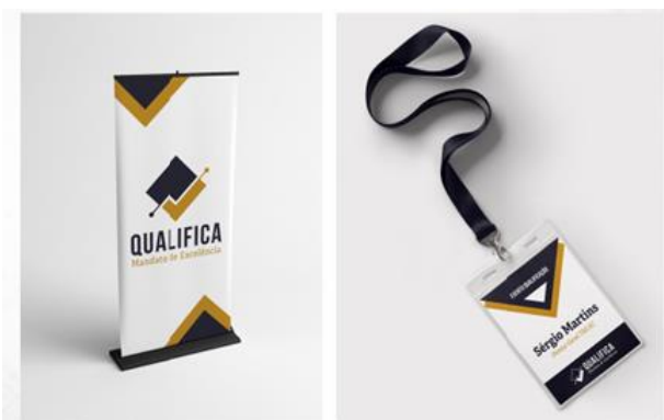
Figura 6: Aplicações da marca 5