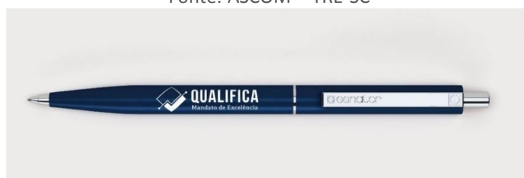
Figura 3: Aplicações da marca 2